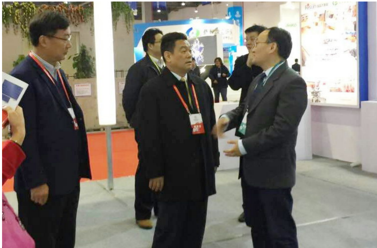
市委副书记、市长董晓健(左二)与公司总经理张中良(右一)在展会现场亲切交谈。

本报讯 桂铖报道:11月25日至28日,以“绿色发展让世界更美好”为主题的第四届世界绿色发展投资贸易博览会(以下简称“绿发会”)在江西南昌举行。全国政协副主席王正伟巡馆参观了公司展台。市委副书记、市长董晓健莅临公司